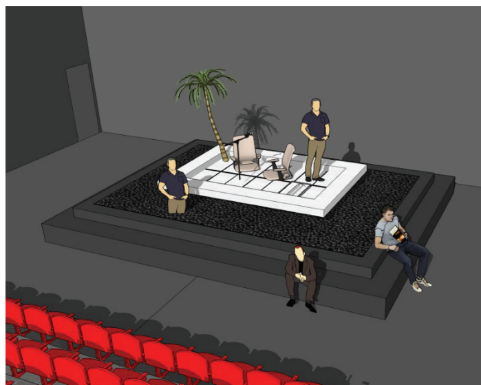
Maquette virtuelle du décor

Après avoir vu le spectacle, nous sommes en mesure d'affirmer que cette image représente l'inaction d'un certain groupe de personnes face aux changements climatiques.