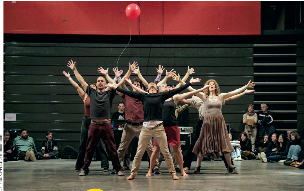
CIE DOUX SUPPLICE