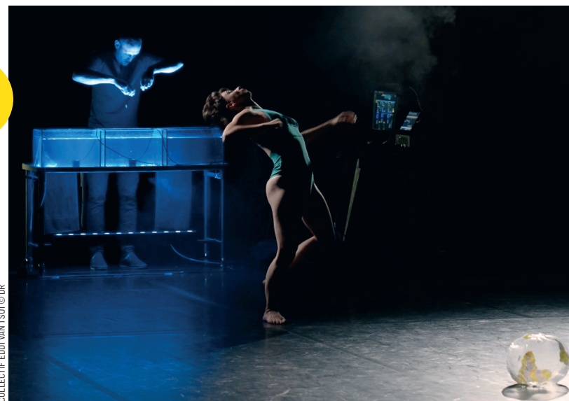
COLLECTIF EDDI VAN TSUI © DR