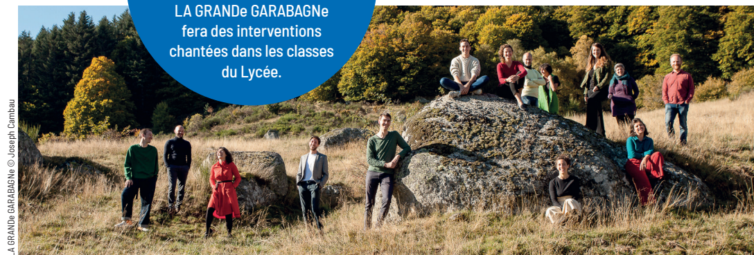
LA GRANDE GARABAGNE

Pour aller au plus près des élèves et des équipes pédagogiques, en plus du récital, LA GRANDE GARABAGNE fera des interventions chantées dans les classes du Lycée.