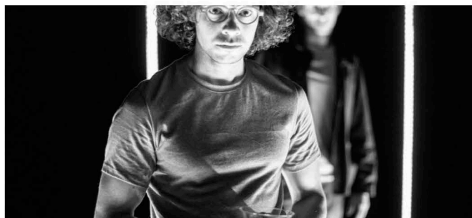
« L'Odysée », grand prix du jury pour la catégorie 6-10 ans.

Par L'Alsace - 06 févr. 2022 à 20:35 - Temps de lecture : 1 min