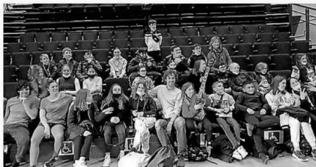
Les comédiens et les élèves ont travaillé ensemble une semaine.