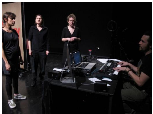
Photo de répétition/recherche création sonore

Enfin, le créateur sonore joue au clavier en direct pour soutenir les extraits d'interviews audio de la manière la plus organique possible.